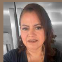
María Becerra Visionaria